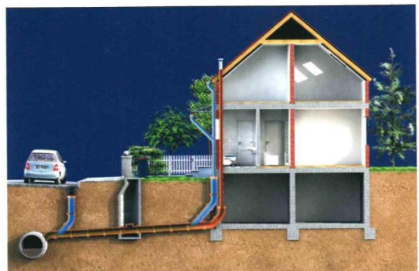
Anschluss an die Mischwasserkanalisation